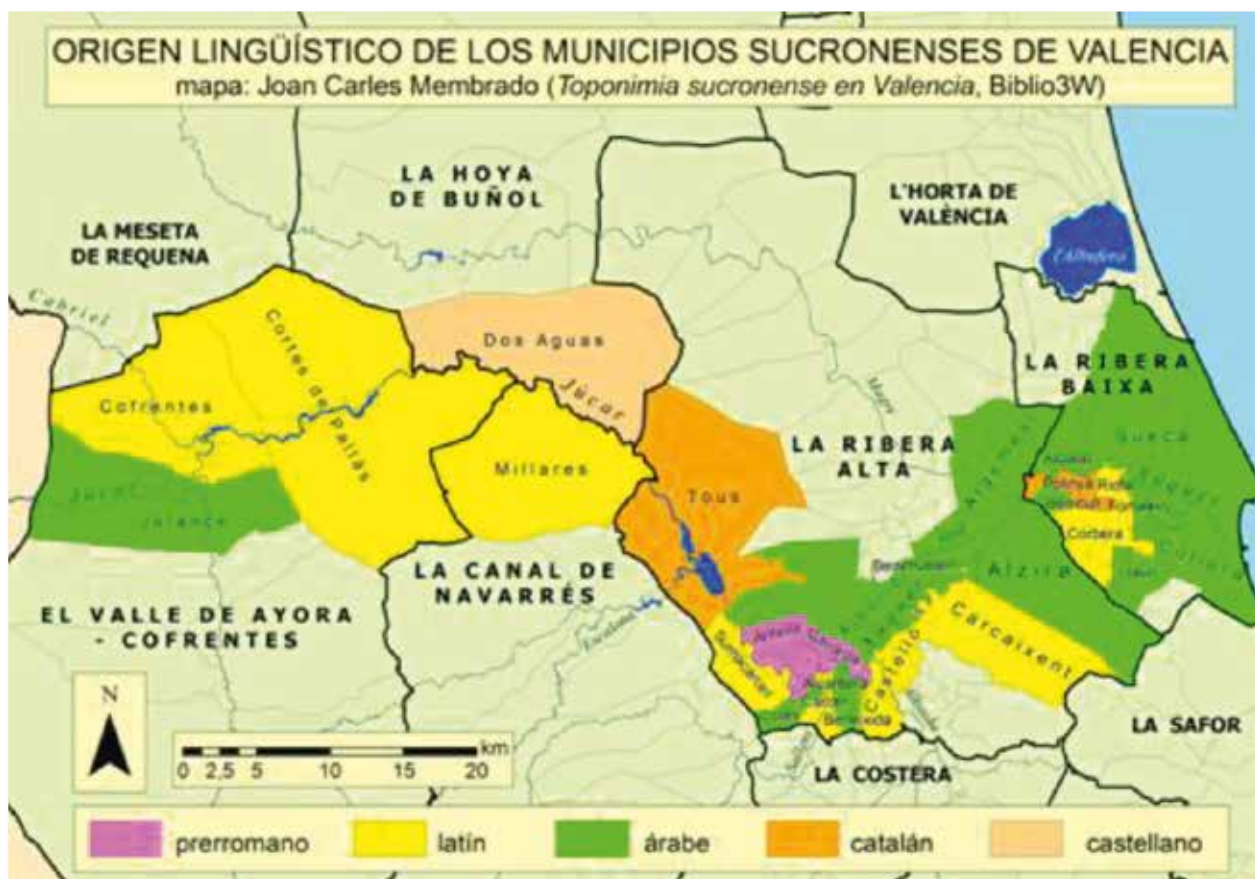
Figura 7.- Origen lingüístic dels municipis sucronenses de València proposat per Joan Carles Membrado.

Esmentem totes aquestes qüestions a propòsit de la toponímia, per posar de manifest la importància de les vies de comunicació i els camins, que si a època islàmica van començar a estendre's, durant l'època antiga encara tindrien una rellevància més marcada. Per això