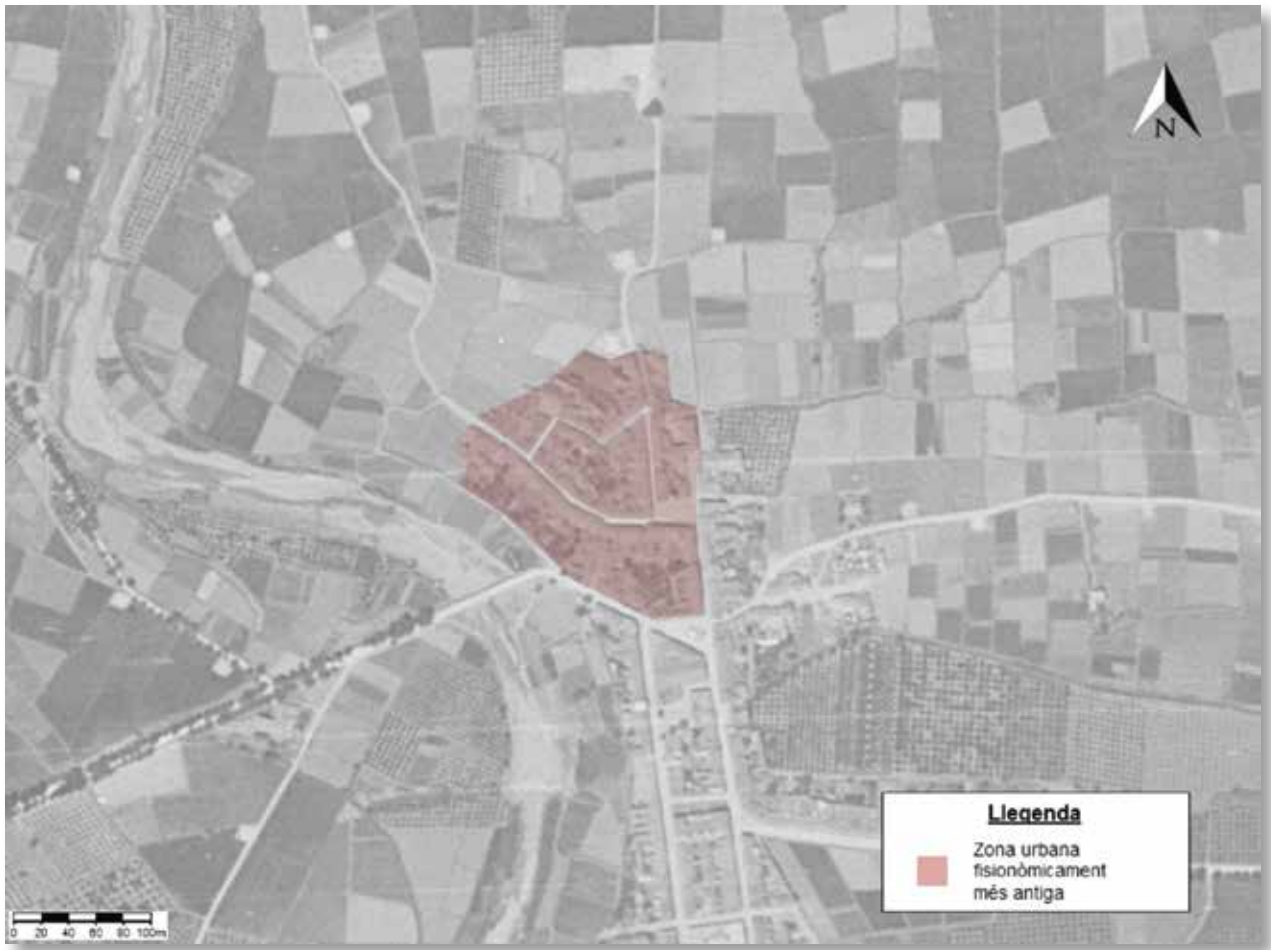
Figura 2.- Mapa del poble de Càrcer on es delimita el casc antic coincident a l'actual barri de Sant Roc i part dels carrers de l'Església i Santa Ana.

antic del municipi. Ens basem en la descripció de la pròpia fitxa arqueològica que va donar a llum aquesta troballa el 1992, en la que apareix textualment: “...al carrer del teular es van descobrir les restes d'un possible forn de terrisseria, probablement romà. Posteriorment, va ser una alqueria islàmica” 5 . Una informació que corroboren els escrits d'Enrique Pla Ballester 6 i també de Daniel Serrano Várez 7 .